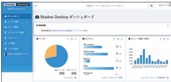
Shadow Desktop Manager管理画面 ※画面は開発中のものです。